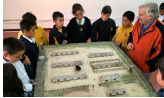
Educación en DDHH a estudiantes de la comuna, 2019.

Desde septiembre de 2018, luego que la Municipalidad de Puchuncaví traspasara en comodato por un periodo de 20 años a la Corporación una superficie de