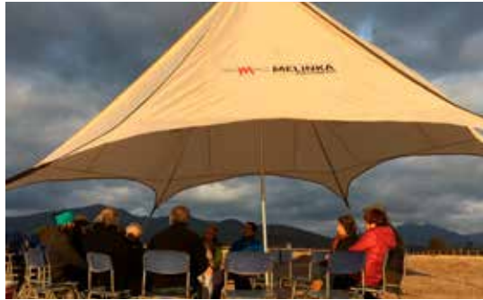
Conversatorio con comunidad de Puchuncaví, 2019.

Desde mediados del año 2013 ex prisioneros, entre ellos el actual Presidente de la Corporación, hicieron algunas visitas al ex Campo de Prisioneros en las cuales encontraron no solo algunos vestigios, sino restos de un par de edificaciones. El año 2014 se constituyó formalmente la Corporación de Memoria y Cultura de Puchuncaví, cuya misión es “Promover en la sociedad chilena una cultura de los derechos humanos y en particular en la comunidad de Puchuncaví, a través del rescate y puesta en valor de la historia y la memoria de las prácticas culturales desarrolladas en el Campo de Prisioneros Políticos de Melinka - Puchuncaví”.