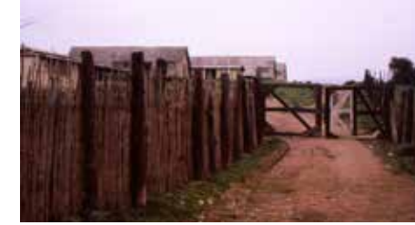
Acceso original al Campo de Prisioneros Políticos Melinka-Puchuncaví Fotografía tomada por Rodrigo del Villar Cañas, 1984 ©.