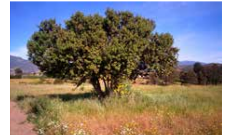
Árbol del Campo de Prisioneros Políticos Melinka-Puchuncaví declarado Monumento Nacional.