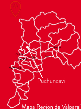
Mapa Región de Valparaíso

El Sitio de Memoria Balneario Popular y Campo de Prisioneros Políticos Melinka, se ubica en la comuna de Puchuncaví, en la Avenida Presidente Ríos s/n, al lado sur de la Tenencia de Carabineros. El terreno se emplaza frente a la copa de agua del pueblo.