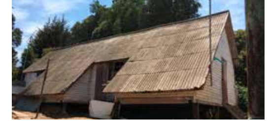
Cabaña del Campo de Prisioneros Políticos Melinka-Puchuncaví. declarada Monumento Nacional Categoría Histórico.