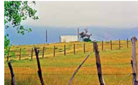
Vista desde Ruta F-30-E al Campo de prisioneros, Fotografía tomada por Patricio Mason, 1988