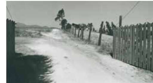
Acceso original al Campo de Prisioneros Políticos Melinka-Puchuncaví. Fotografía tomada por Franklin Troncoso Muñoz, 1993.